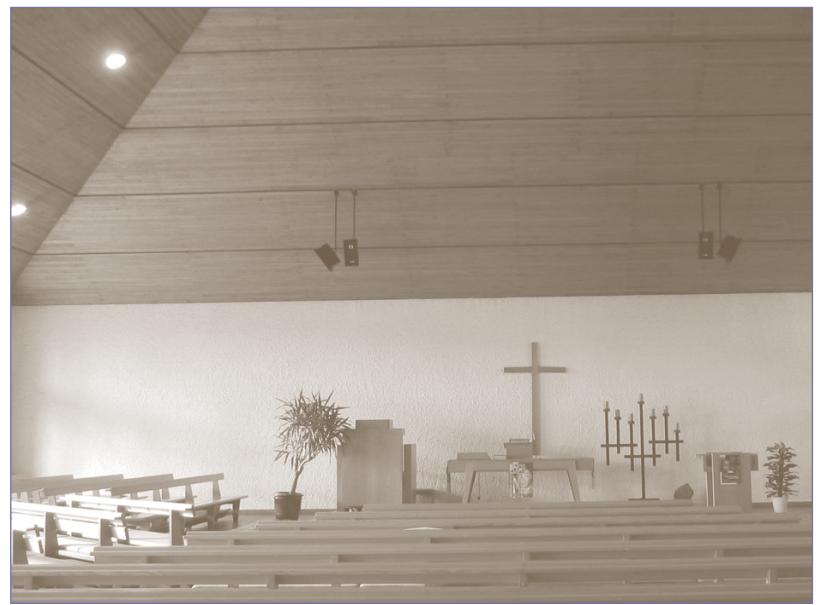
Zwinglikirche Zustand Herbst 2006 vor der Sanierung

Die vom damals jungen Architekten Dieter Feth erbaute Zwingli-Kirche bestach durch ihre schlichten und klaren Formelemente von aussen wie auch im Kirchenraum: erdfarbiger Boden, massive murale Wandscheiben und das Zelt Dach. Grundsätzlich genügten die Raumdispositionen, waren jedoch aufgrund veränderter Bedürfnisse oder aus Altersgründen mangelhaft: das Sekretariat sollte integriert werden, generell fehlten Räume für Gruppen, der Entréebereich war funktionell unbefriedigend. Zudem waren Behaglichkeits-Mängel aufgrund des Standes der Technik im Erstellungszeitraum aus heutiger Sicht unverkennbar.