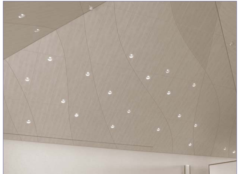
Zwingli-Kirche Januar 2008: Bildausschnitt neues Zelt Dach